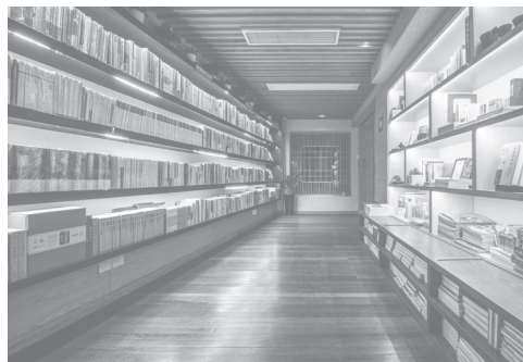
大隐书局武康大楼店

上海淮海路上，宋庆龄故居的对面，正是沪上知名的文艺地标武康大楼，文艺青年的必去之地。第一家大隐书局便坐落于此，2016年5月开业。