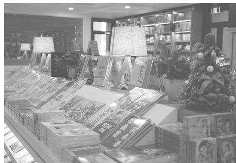
杨浦人文书房·大隐书局

成都仁和新城店则是大隐从上海走出去在外地开的第一家书店，同时也是大隐的第一家音乐主题书店，这是一次全新的尝试与突破。书店内藏着一家琴行，让阅读呈现更多可能性。“为守望者暖茶，为夜行人燃灯”，大隐希望提供给大众的不仅是一家书店，更是修身养性的文化空间。读书品茶，听音乐作手造，一份温暖的情怀，独守清静，希望这里能唤醒渴望，给予你肉体 and 灵魂力量。