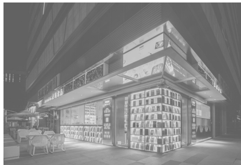
大隐书局创智天地店

大隐书局作为上海本土书店品牌，已有武康大楼店、巴黎春天店、大隐精舍、思源书廊、创智天地店、成都仁和新城店、杨浦人文书房这八家书店。