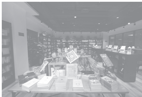
齐鲁工业大学校园书店