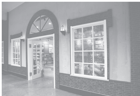
济南一中校园书店

自2015年起，根据山东出版集团、山东新华书店集团工作部署，山东新华书店集团有限公司济南分公司（以下简称济南分公司）本着“服务学校、服务学生”的原则，逐步开拓校园书店业务。目前，已拥有两所高中校园书店，三所高校校园书店，均采用济南分公司的自主品牌——“悦客书吧”，秉承新华书店的优秀品质，打造以图书为主，集咖啡简餐、文具文创、休闲生活、文化活动等多种体验于一体的阅读空间，为学校师生提供文化服务。