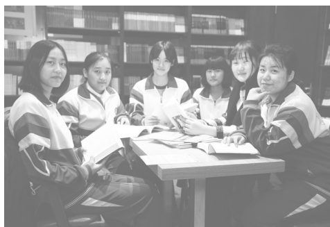
学生在书吧内学习

悦客书吧·济南一中校园店创新运营模式，增强了学生的主人翁意识，锻炼自主的管理能力。为学校开辟了综合素质实践基地的同时，进一步发挥服务教育的宗旨。